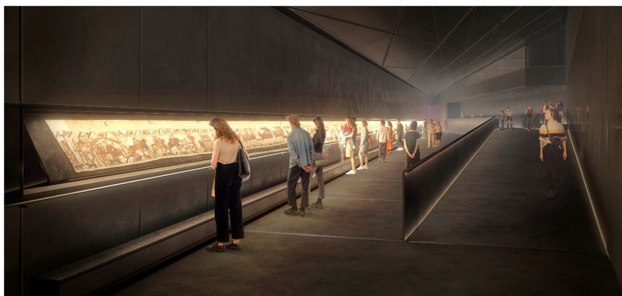
Images : Plan aérien du futur musée de la Tapisserie de Bayeux et visualisation de la future galerie d'exposition

Direction Régionale des Affaires Culturelles